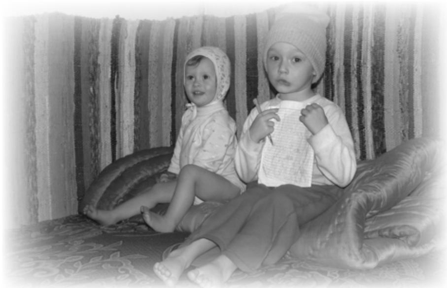
In de huizen is het moeilijk warm te krijgen

In december 2006 schreef ik over een meisje dat dringend een oogoperatie nodig had. Ik schreef toen, dat de onderzoeken begonnen waren. In die periode stelden de oogartsen vast dat de operatie weinig nut had, omdat het meisje nog zou groeien. Intussen is zij